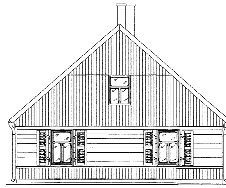
ELEWACJA POŁUDNIOWO - WSCHODNIA

KOMENDA WOJEWÓDZKA PAŃSTWOWEJ STRAŻY POŻARNEJ w Warszawie WYDZIAŁ KONTROLNO-ROZPOZNAWCZY Załącznik do postanowienia WZ.55. 85. 445. 1. .20/16 r.